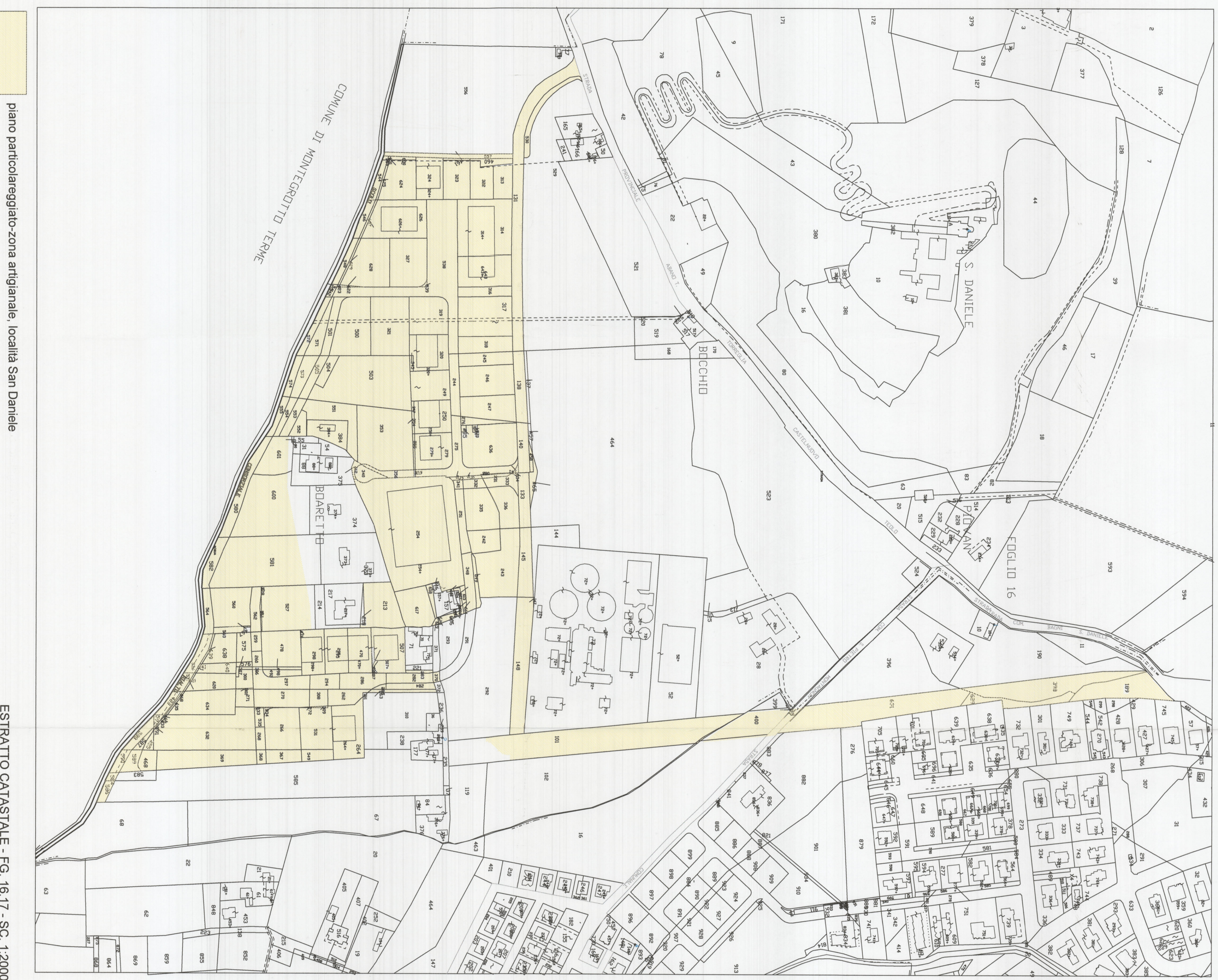
piano particolareggiato-zona artigianale, località San Daniele

ADOSSATO CON DELIBERA S. C. n. 8 del 28/10/14 F. M. G. M.