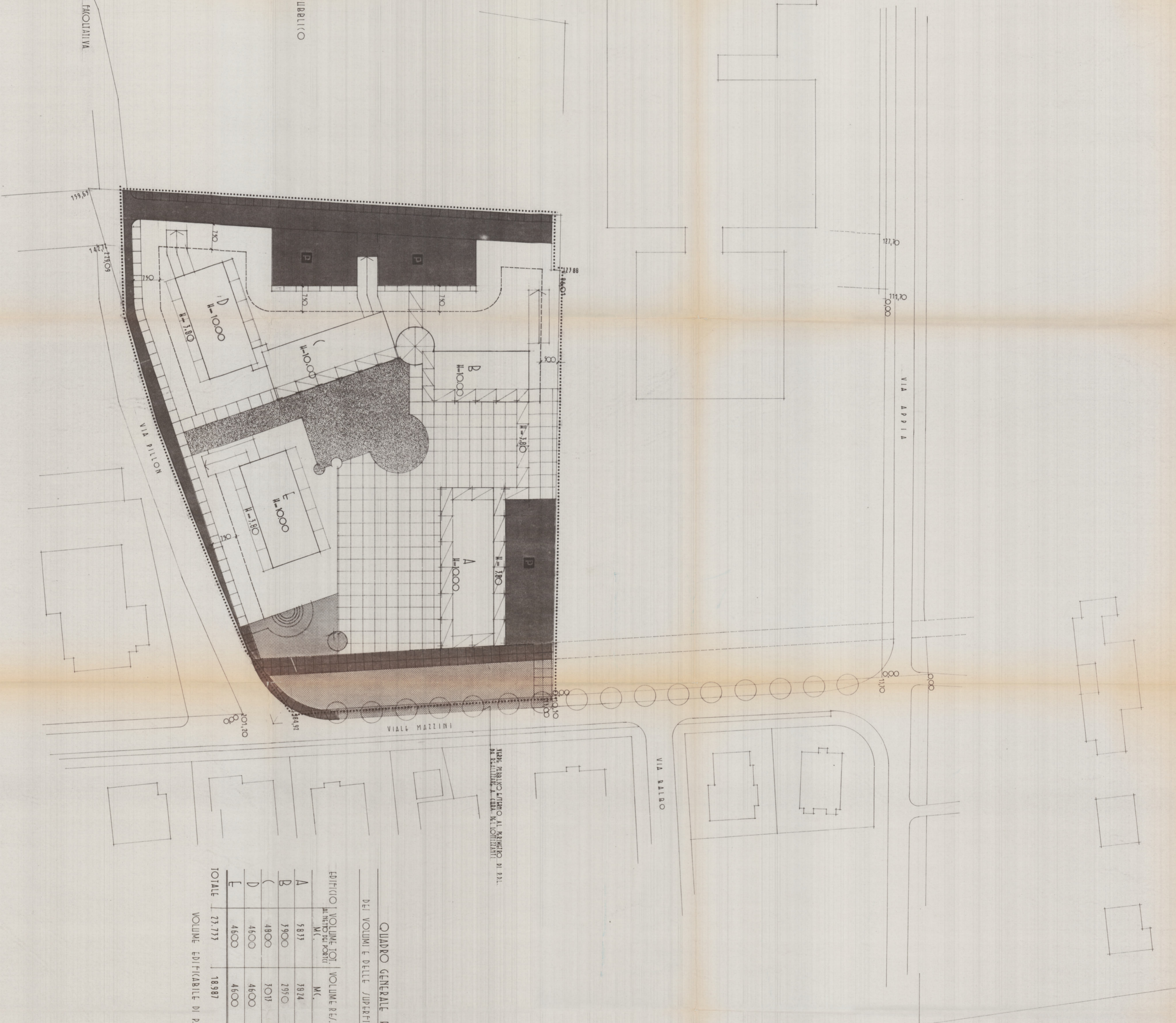
QUADRO GENERALE RIPILOGATIVO INDICATIVO DEI VOLUMI E DELLE SUPERFICI COMMERCIALI E DIREZIONALI