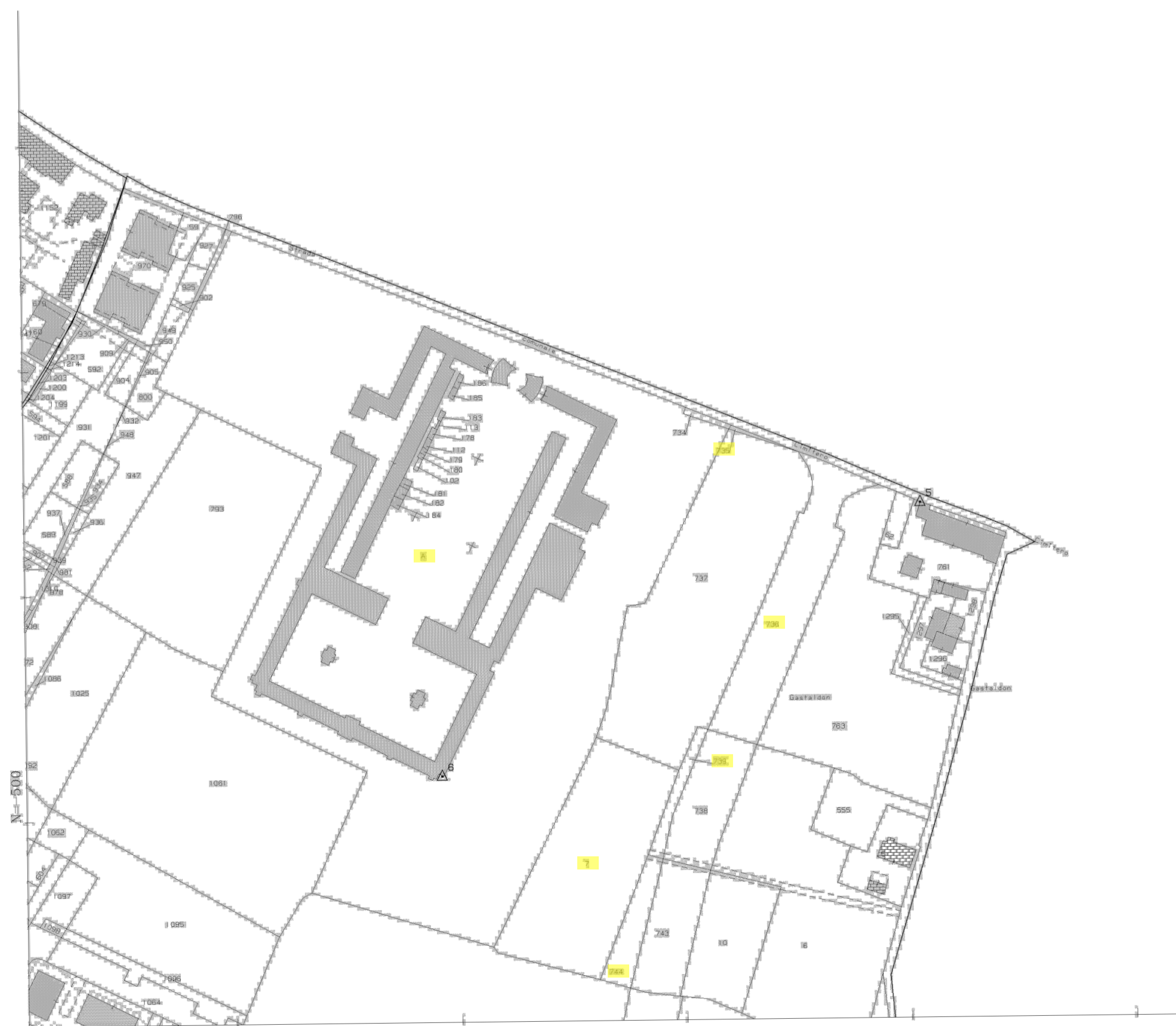
ESTRATTO CATASTALE CON EVIDENZIATE LE PARTICELLE DI PROPRIETA' COMUNALE